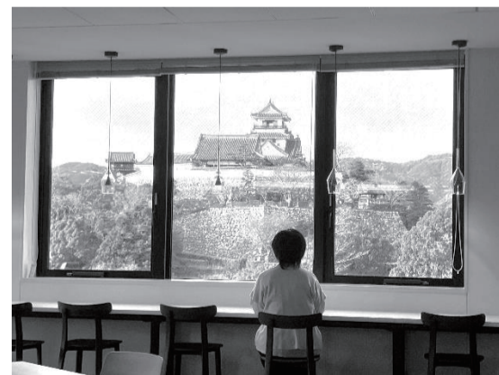
新社屋8階ラウンジからの眺め =高知市本町4丁目

引っ越しと相前後して書記局の仕事もアップデートされました。一番はペーパーレス化です。この際、「ガシャコン、ガシャコン」と音を立てて組合ニュースを刷っていた印刷機は処分。組合員アンケートや各種投票の電子化などもやっています。もちろん、組合員同士のコミュニケーションを密にして、要